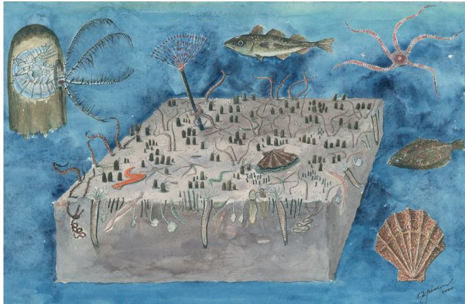
Haploopsmiljö. Teckning: S.B. Johnson 2001, Källa: Peter Göransson.

The horse mussel ( Modiolus modiolus ) forms dense banks, which make up one of the most species-rich habitats along the Swedish coast. Another important habitat is the Haploops community, which is named after the small crustacean Haploops. This combination of Modiolus and Haploops is most likely very rare.