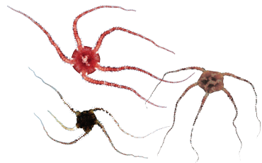
Ornstjärnor Ophiura robusta