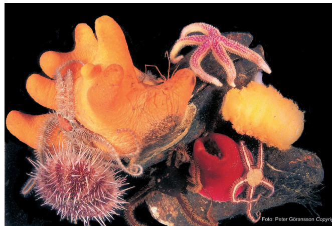
Många olika arter kan man finna inom Knähakenområdet, bland annat sjöstjärna, sjöborre och dödmanshand.

Beslut om bildande av naturreservat togs i kommunfullmäktige 2001 02 07.